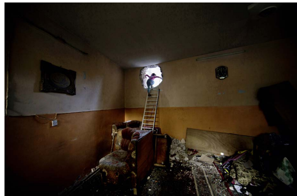
MOSSOUL, IRAK, AVRIL 2017

SNCF Gares & Connexions , branche de la SNCF en charge de la gestion, de l'exploitation et du développement des 3 000 gares françaises, s'engage depuis 2009 à améliorer constamment la qualité de l'exploitation, imaginer de nouveaux services et moderniser le patrimoine pour les 10 millions de voyageurs et visiteurs quotidiens qu'elle accueille.