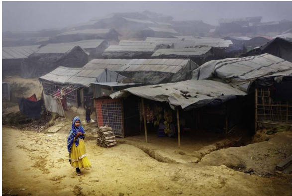
COX'S BAZAR, BANGLADESH, JANVIER 2018

PHOTOREPORTER DE GUERRE SUR L'ESPLANADE DE PARIS GARE DE LYON